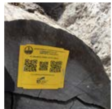
Gambar 7 Atas: Penggunaan tanda V-Legal pada Kayu IPK PT PMM (001°34.799'S 113°877'E)