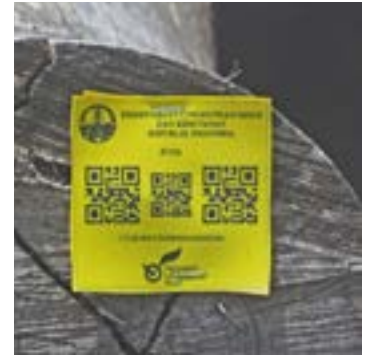
Gambar 9 Kiri: UD Usaha Baru Maju (001°34.799'S 113°877'E)

Pada awal April 2017, JPIK mengajukan keluhan kepada PT IMS terkait pelanggaran yang dilakukan oleh UIIPHHK Juita dan UD UBM terkait ketidakpatuhannya melaporkan RPBBI dan melanggar persyaratan izin. Sebagai respon, PT IMS meminta bukti lebih lanjut untuk mendukung keluhan tersebut, namun hingga saat ini tidak ada respon terhadap keluhan yang disampaikan.