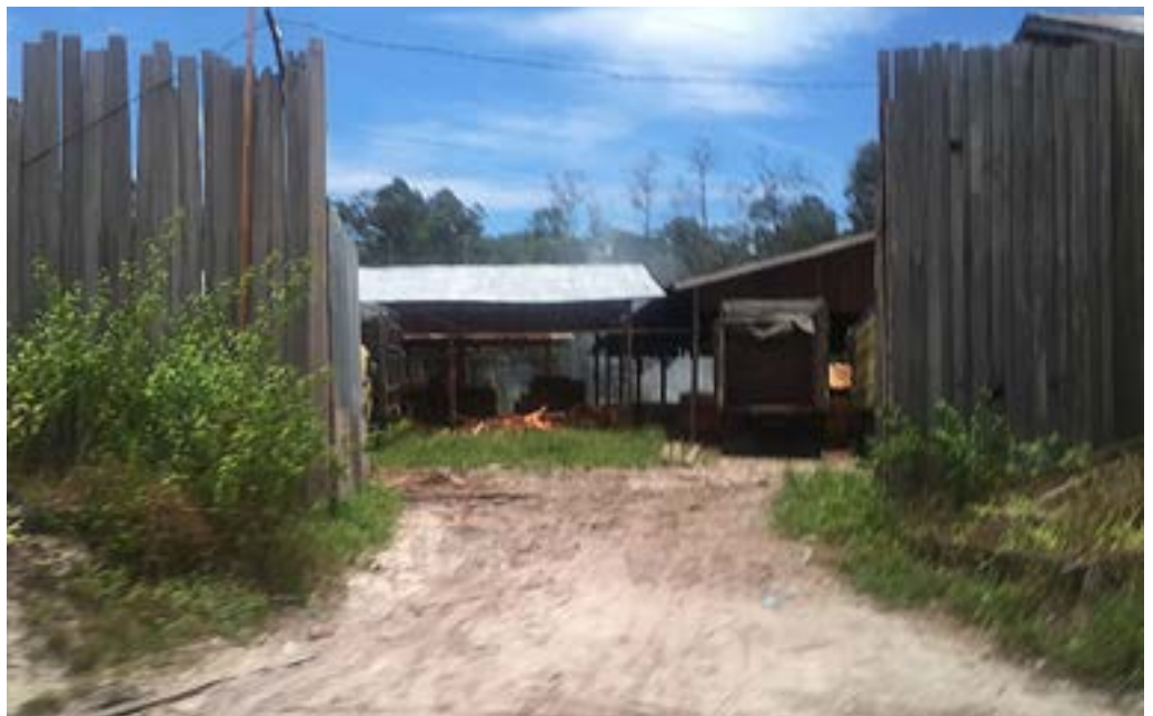
Gambar 18 Bawah: Pembekuan sertifikat UD Family Lambung