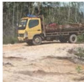
Gambar 19 Atas: pengangkutan kayu bulat di Kampung Bereng Malaka