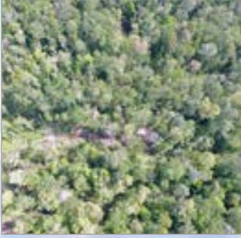
Gambar 21 Atas: Lokasi pembukaan hutan di luar konsesi PT PMM (001°35.142'S 113°41.385'E)

Pengawasan dan penegakan hukum SVLK dan industri kayu yang relevan oleh Kementerian Lingkungan Hidup dan Kehutanan, dan Kementerian Perindustrian, serta Kementerian Perdagangan, telah gagal