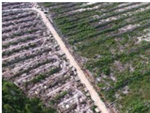
Gambar 2, 3 Kanan: Pembukaan hutan alam oleh PT PMM

Hingga saat laporan ini dibuat – dua tahun berselang sejak laporan disampaikan kepada pihak berwajib – tidak ada penegakan hukum di Indonesia oleh pihak yang berwenang, dan PT PMM tetap meneruskan operasi ilegalnya tanpa hambatan.