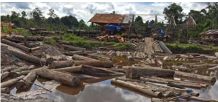
Gambar 8 Bawah: UD Usaha Baru Maju (001°34.799'S 113°877'E)