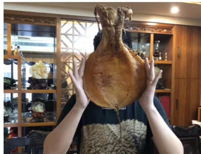
Arriba: Las vejigas natatorias de totoaba son muy codiciadas. Redes del crimen organizado están saqueando las aguas de México para abastecer la demanda de vejigas en China y otros lugares

totoaba se triplicó y el volumen aumentó seis veces en comparación con 2021. En 2023, el número y volumen de las vejigas de totoaba fueron más de cinco veces superiores a los de 2022 en WeChat (véase la Figura 1). Este aumento y trayectoria son alarmantes.