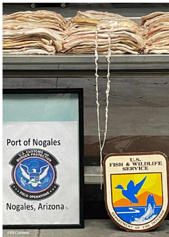
Arriba: Vejigas natatorias de totoaba frescas decomisadas en los EE. UU., junio de 2023

Considerando la persistente disponibilidad de vejigas de totoaba en línea en China, es evidente que los esfuerzos de aplicación de la ley no están siendo suficientemente atendidos. Por lo tanto, se requiere un compromiso renovado por parte de todos los países para tomar medidas.