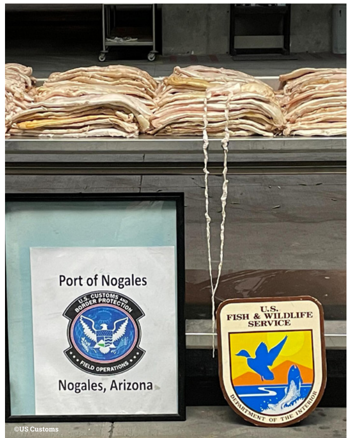
上: 美国于 2023 年 6 月查获了新鲜加湾石首鱼鱼胶。

虽然中国仍然是加湾石首鱼鱼胶的主要市场，但查获记录发现泰国和越南渐成为新兴市场。由于加湾石首鱼鱼胶在中国的网上持续维持，显然执法工作不足，需要所有国家/地区重新承诺采取行动。