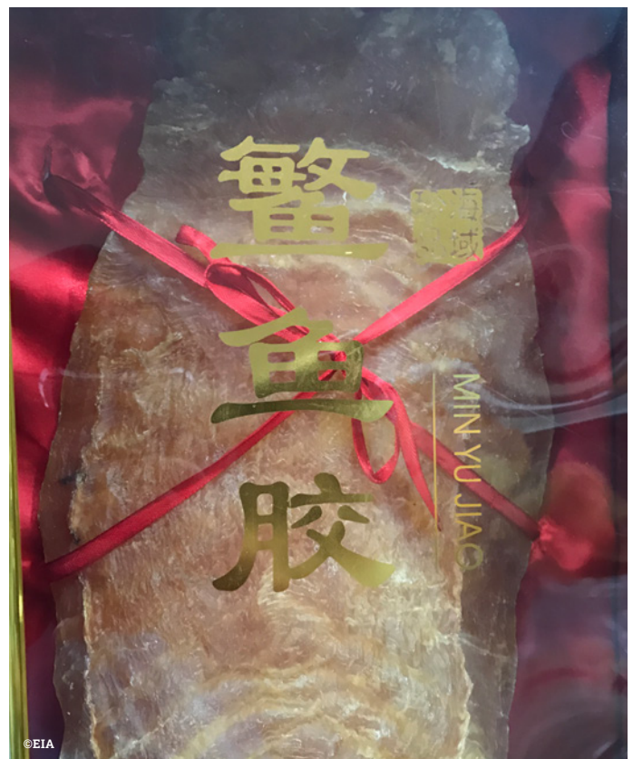
上: 因为不法分子非法捕捞受保护的石首鱼鱼胶，并随后进行走私和零售等有组织的跨国犯罪，导致小头鼠海豚的数量迅速减少。