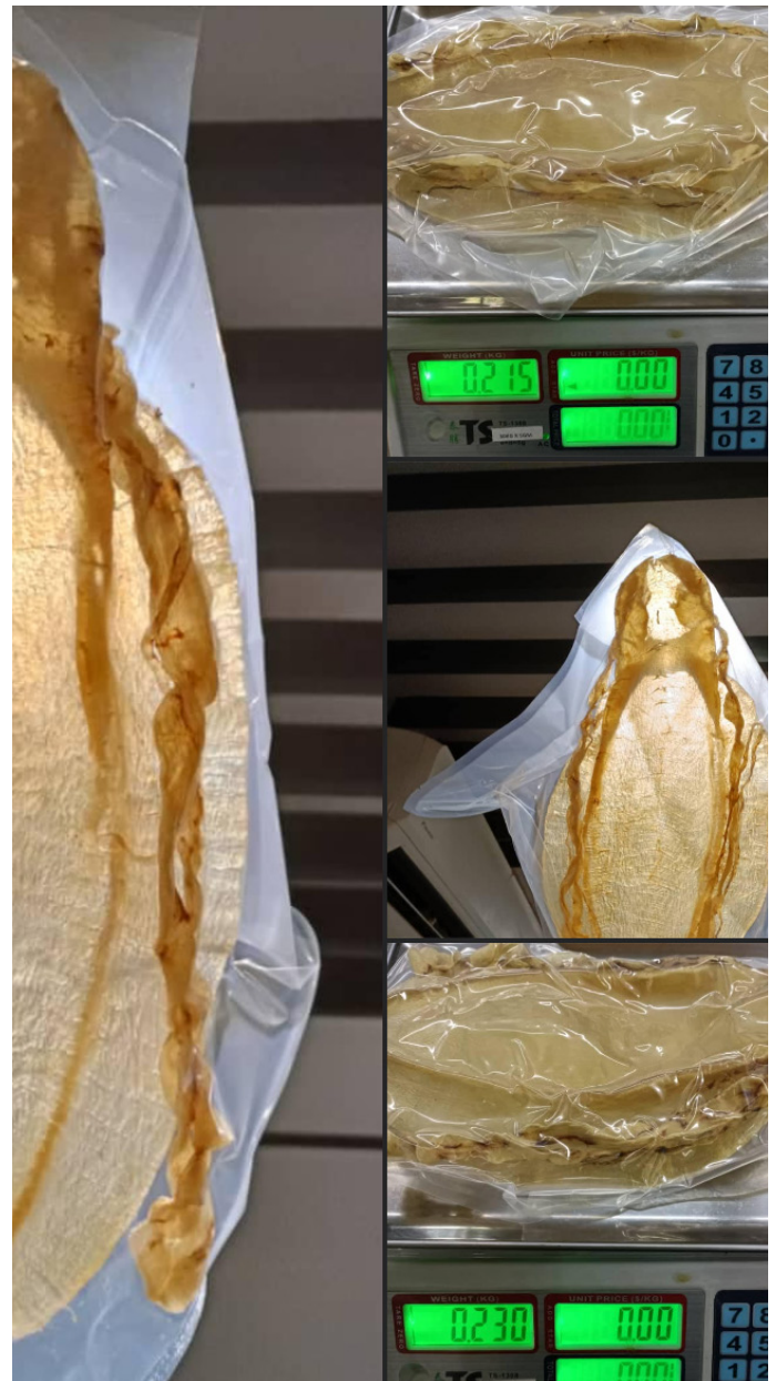
上：加湾石首鱼鱼胶非常珍贵。有组织的犯罪网络正在掠夺墨西哥水域的加湾石首鱼，以满足中国和其他地方的需求

在 Facebook 上发现的加湾石首鱼鱼胶数量低于之前调查表明的数量；然而，微信上出售的数量却显著增加。2022 年加湾石首鱼鱼胶的数量是 2021 年的三倍，销量是 2021 年的六倍。2023 年，微信上加湾石首鱼鱼胶的数量和销量是 2022 年的五倍多（见图 1），其增长速度和趋势骇人听闻。