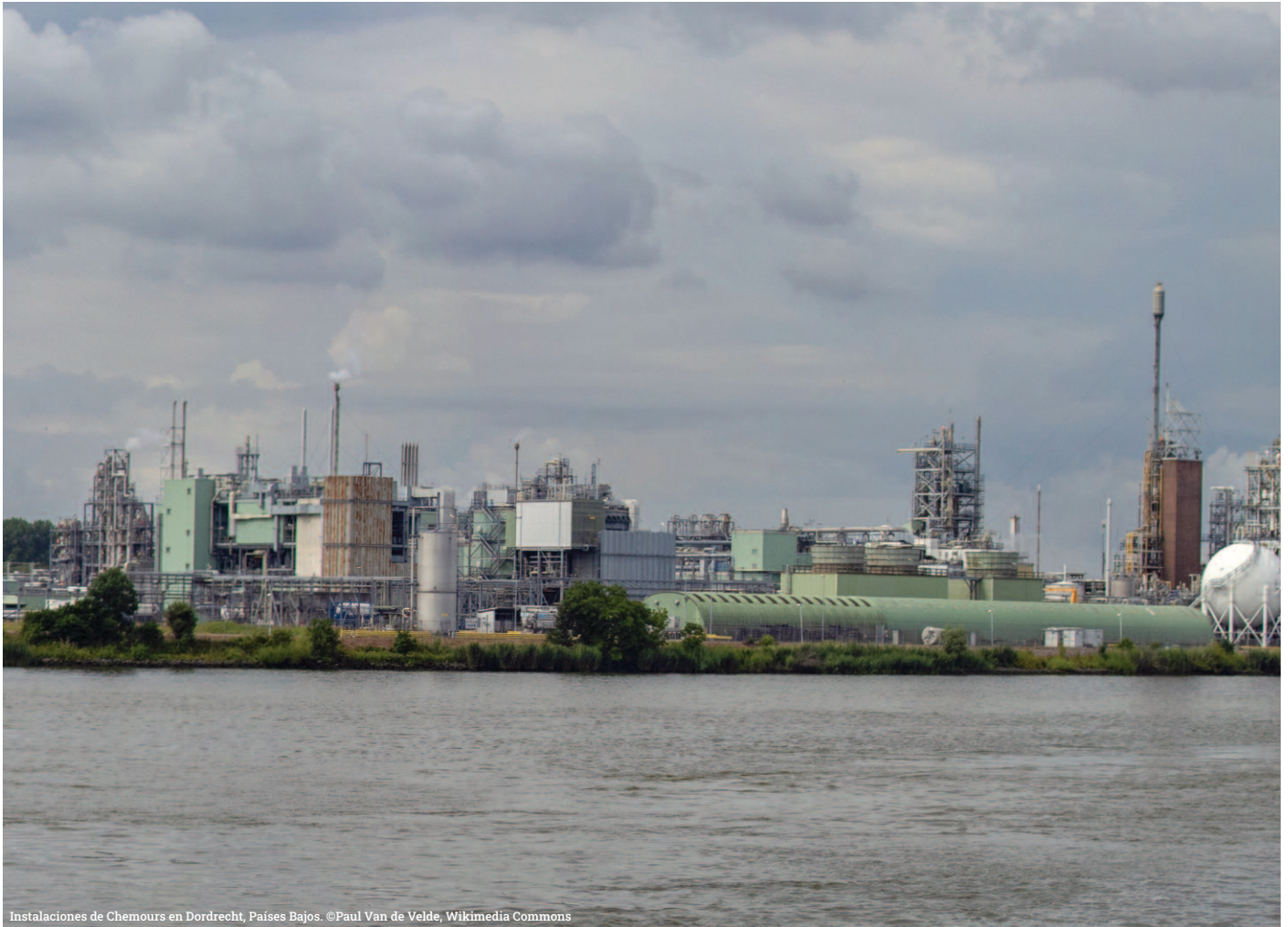
Instalaciones de Chemours en Dordrecht, Países Bajos.