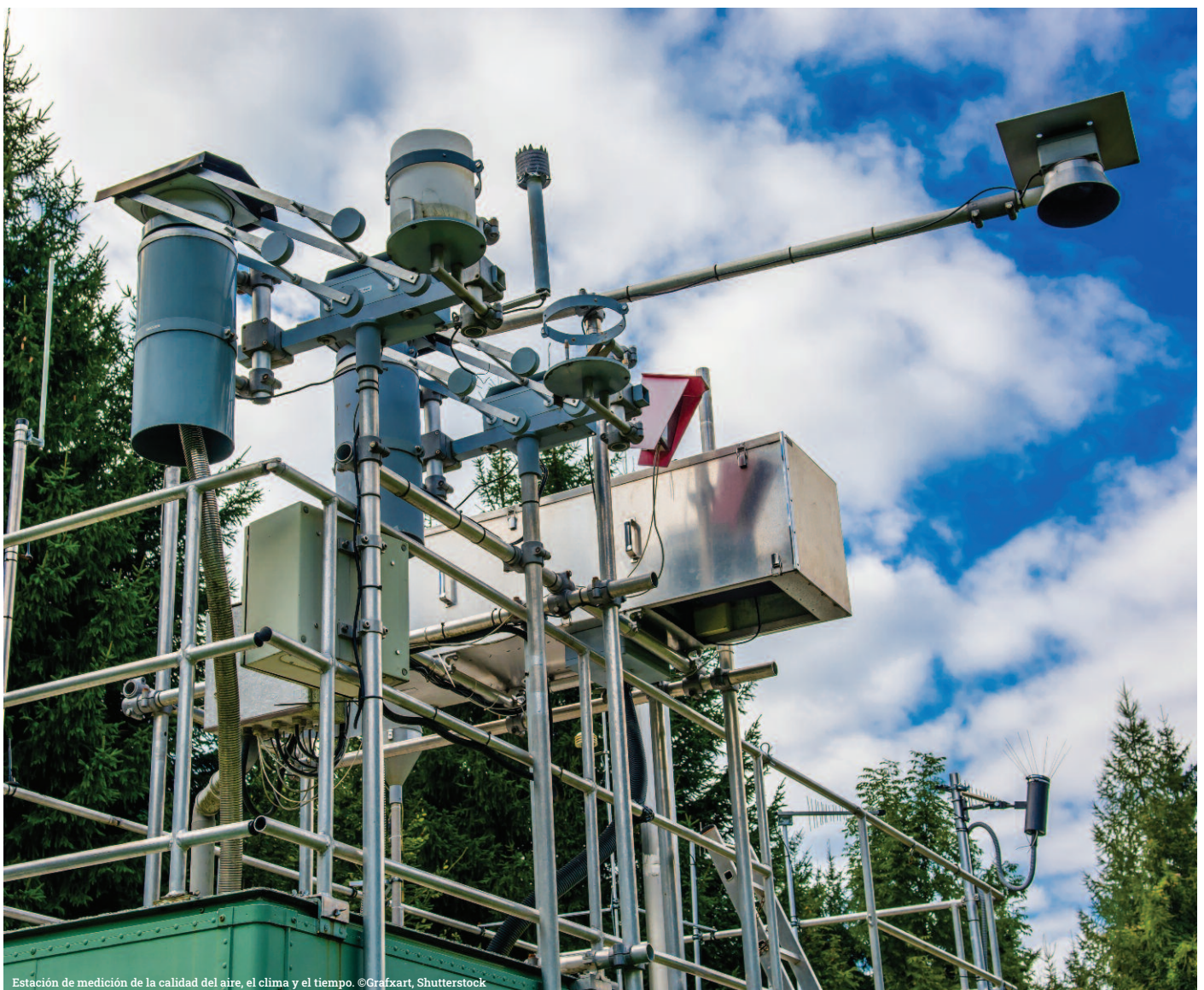
Estación de medición de la calidad del aire, el clima y el tiempo.

EIA hace un llamamiento a las partes para que tomen una decisión en esta reunión que abra el camino a una acción inmediata que logre aumentar el monitoreo atmosférico y garantizar la transparencia de datos de las estaciones de monitoreo en el futuro, para lograr una mejor aplicación y rendición de cuentas.