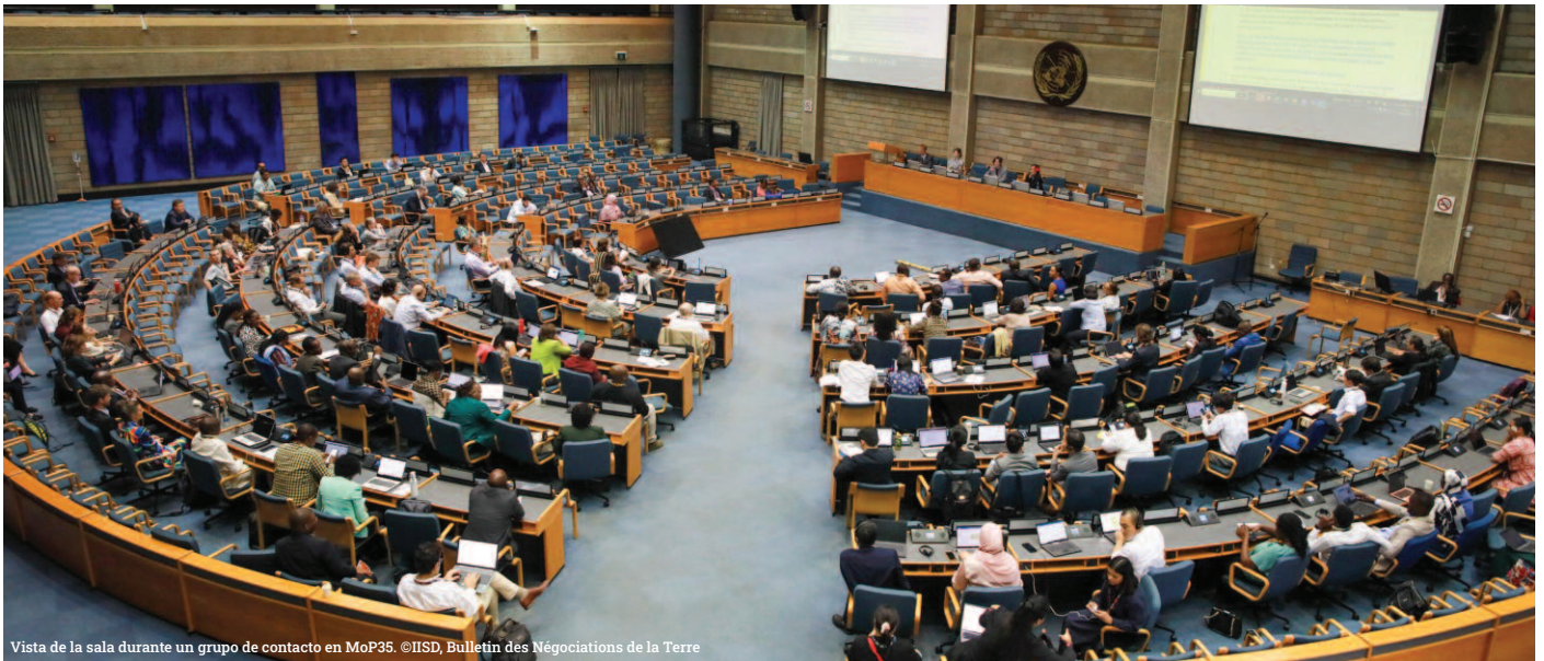
Vista de la sala durante un grupo de contacto en MoP35.