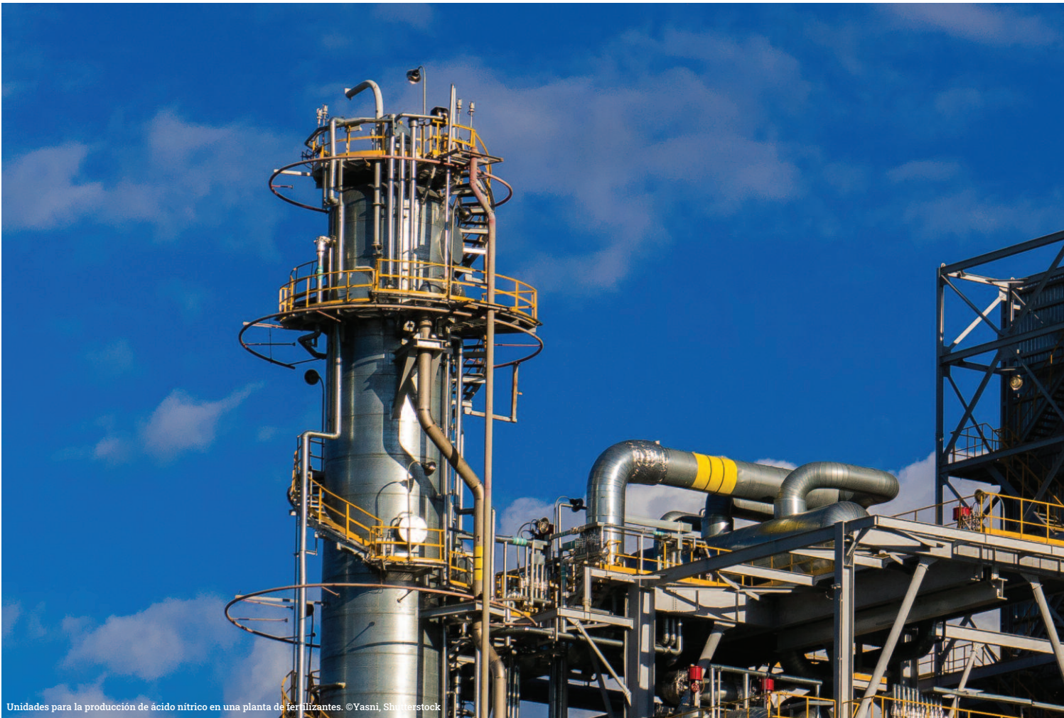
Unidades para la producción de ácido nítrico en una planta de fertilizantes.