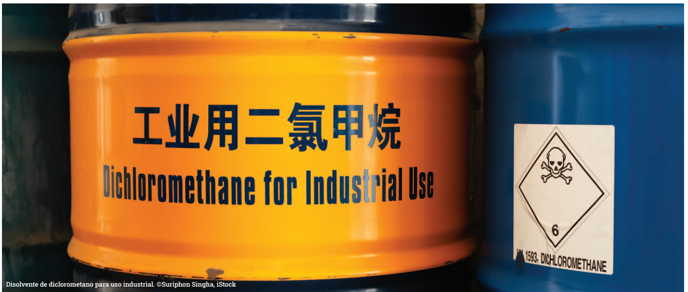
Disolvente de diclorometano para uso industrial.